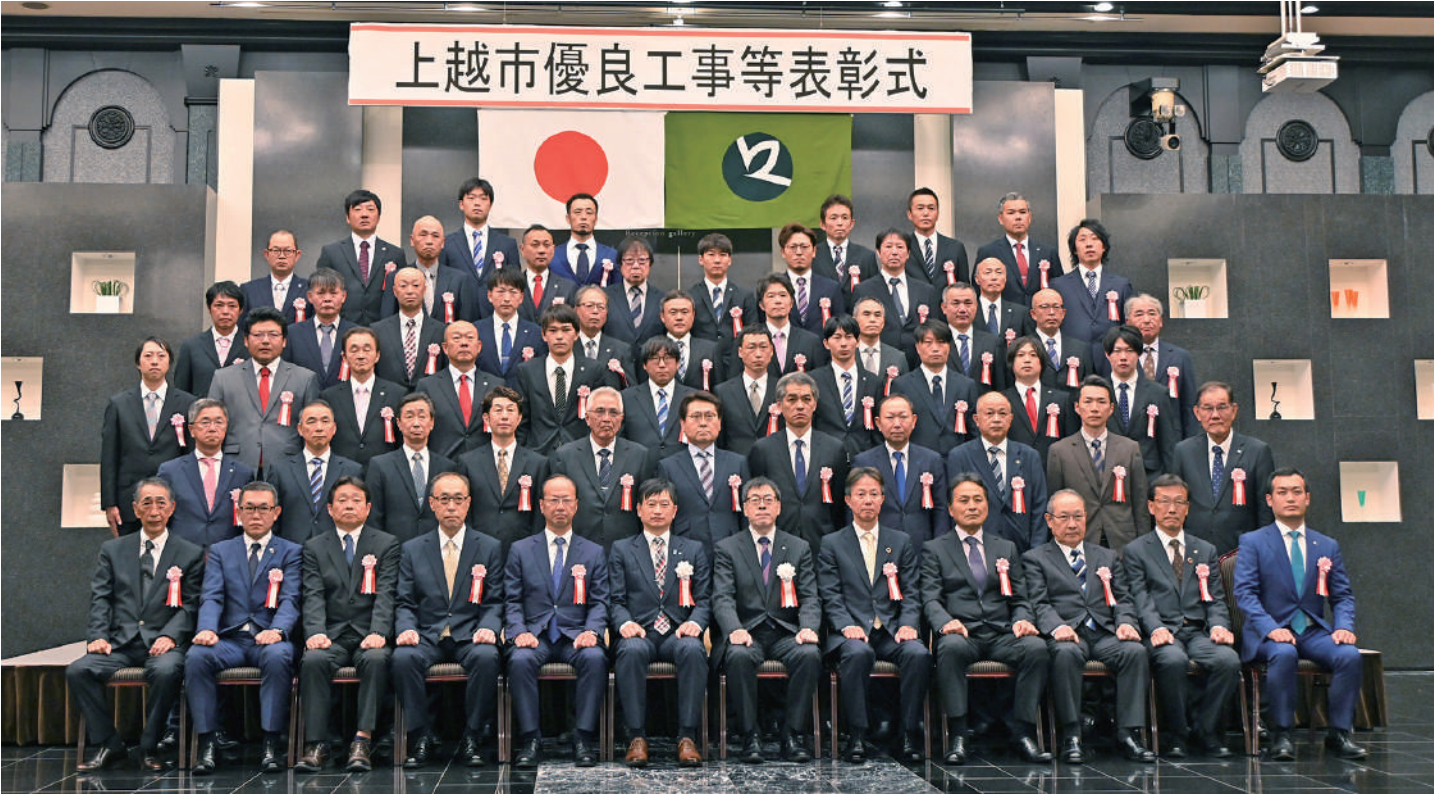
受賞者全員で記念撮影

上越市の社会基盤整備に貢献し、優れた成績を収めた企業を表彰する2025年度(令和7年度)優良工事等表彰式が10月6日にデュオセレンで開催された。上越市発注分では24年度完成工事の中から優良工事表彰として30工事を施工した延べ33社が受賞し、優良建設技術者延べ35人を表彰。また上越市ガス水道局発注分では工事成績評価を行った9件の工事で、延べ9社が優良工事、9人が優良建設技術者を受賞した。式典では市が受賞の榮譽をたたえた上で、優良な施工と担い手育成に向けた技術継承に期待を寄せ、受賞者一同が今後も上越市発展と市民生活向上への貢献に努めることを誓った。